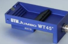
SYM JUMBO WT